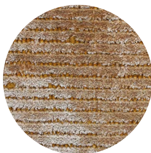
34 Sweet Rose