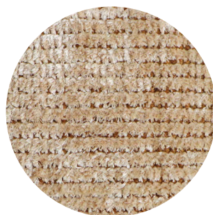
33 Soft Beige