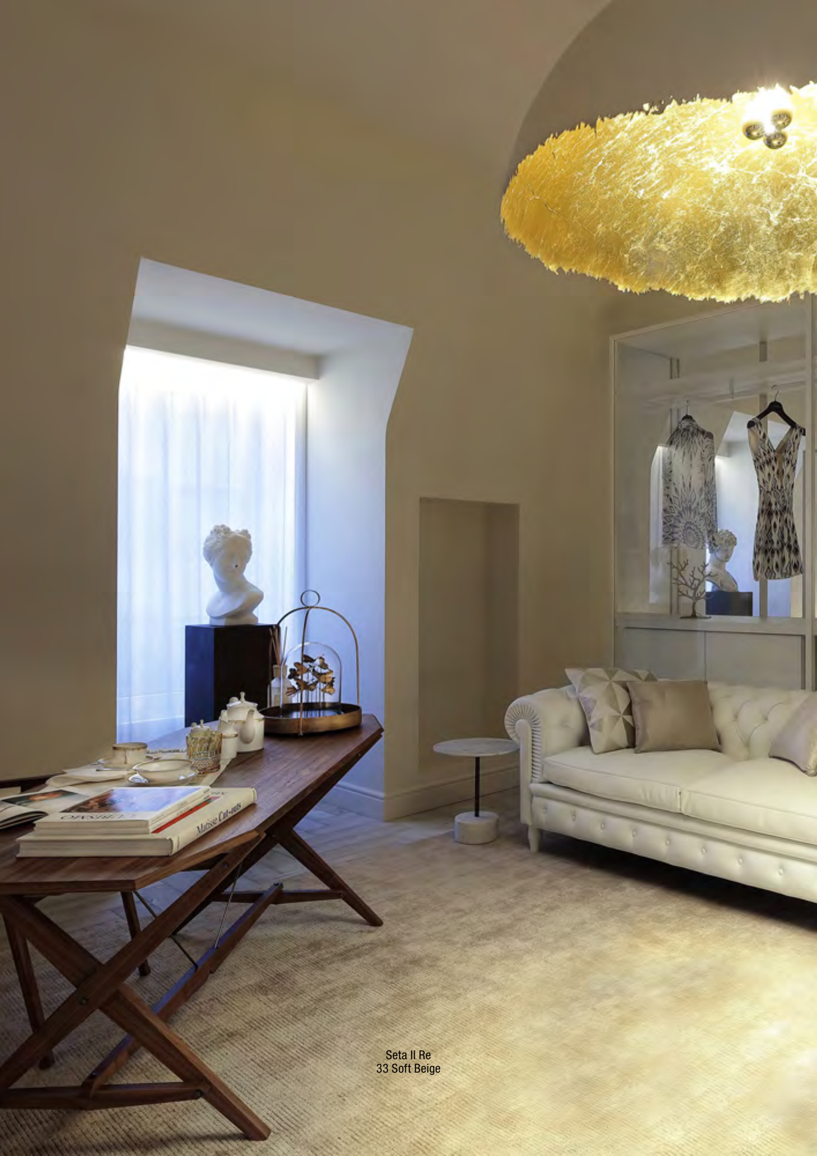
Seta II Re 33 Soft Beige