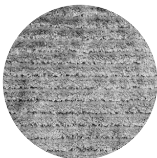
07 Venice Lagoon