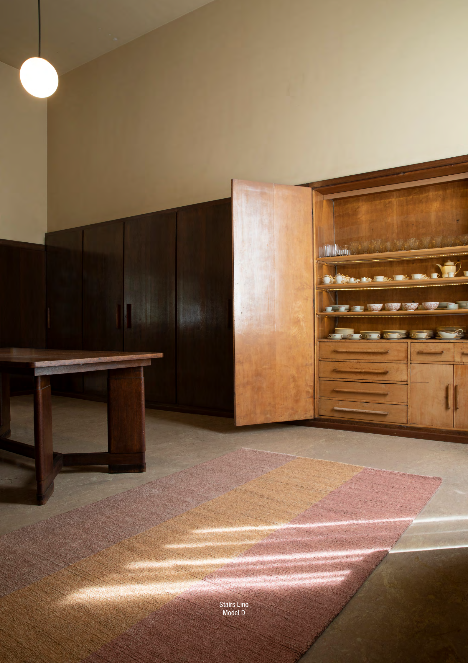
Stairs Lino Model D