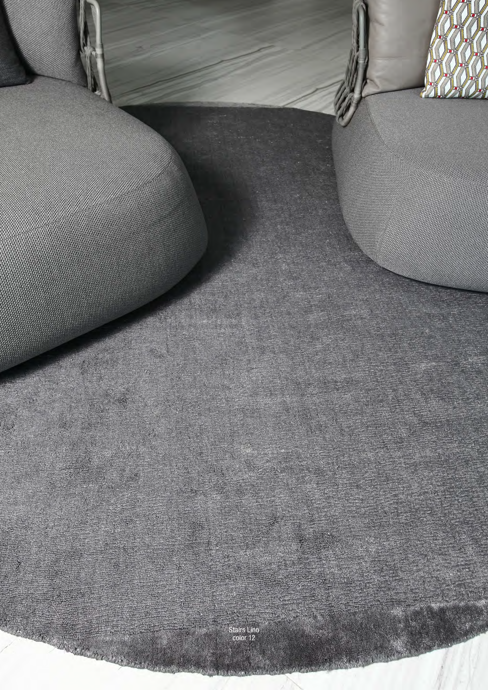
Stairs Lino color 12