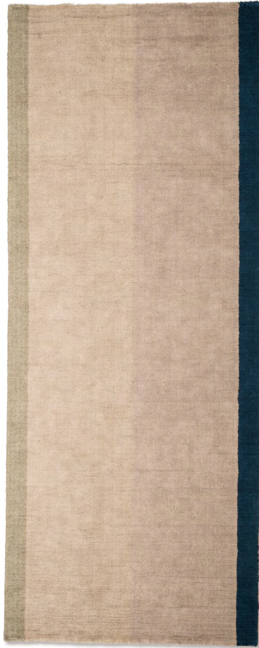
Stairs Lino Model C 120 x 300 cm | 3'11" x 9'10" ft