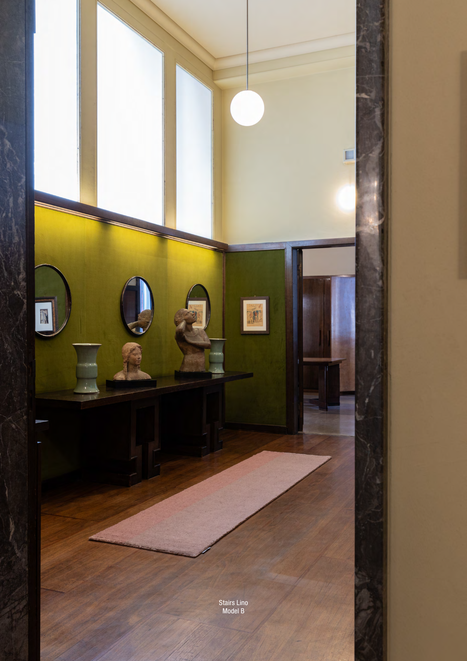
Stairs Lino Model B