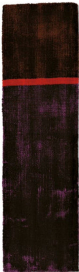
Viola Astratto 2 limited edition 60 x 200 cm | 2' x 6'6" ft