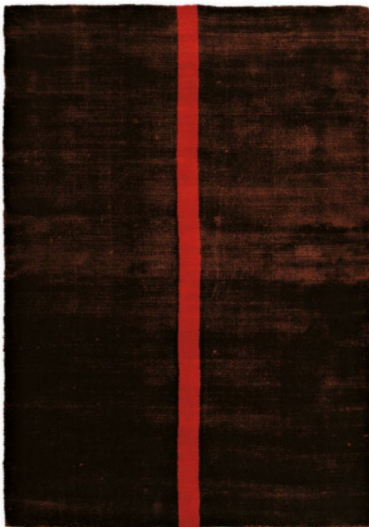
Rosso Vivo 1 limited edition 170 x 240 cm | 5'7" x 7' 10" ft