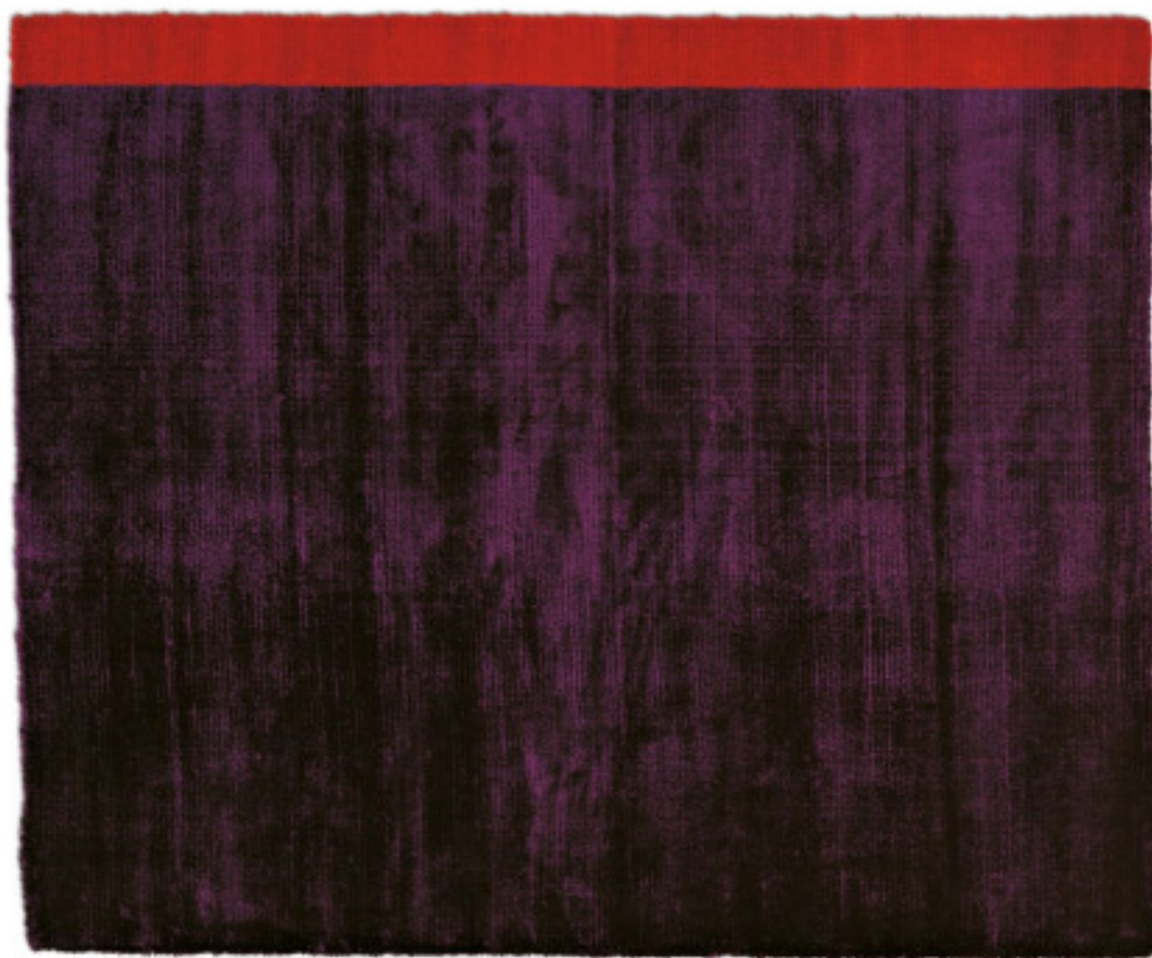
Viola Astratto 1 limited edition 200 x 240 cm | 6'6" x 8' ft