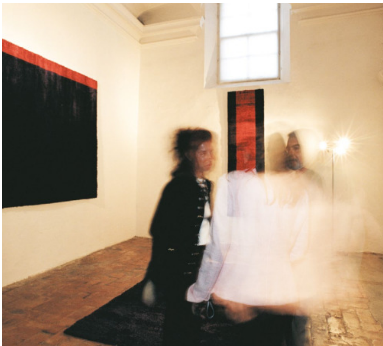
Viola Astratto 1 limited edition 200 x 240 cm | 6'6" x 8' ft