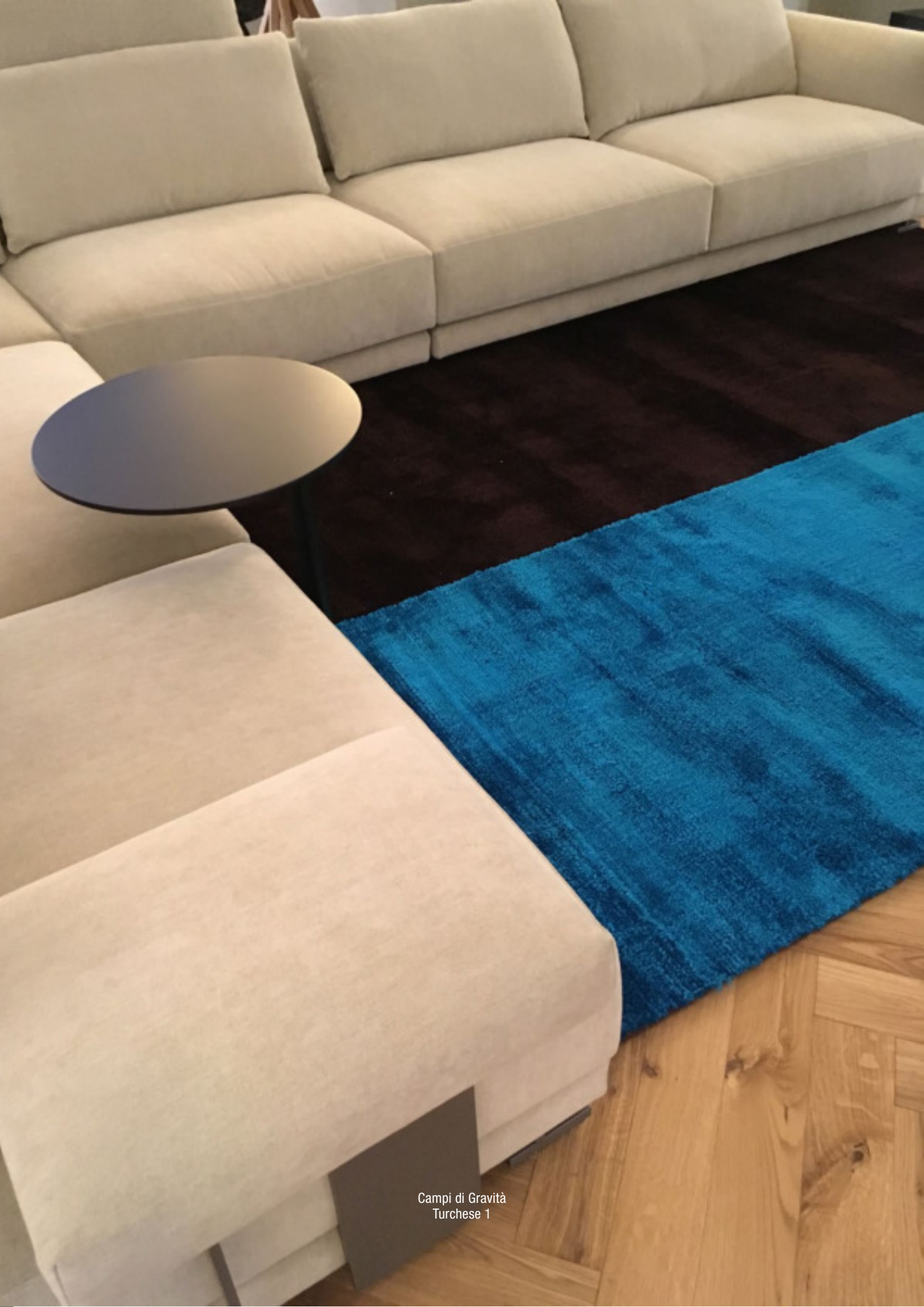
Campi di Gravità Turchese 1