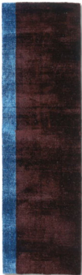
Turchese 2 limited edition 70 x 240 cm | 2'3" x 8' ft