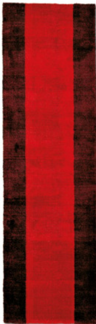
Rosso Vivo 2 limited edition 70 x 240 cm | 2'3" x 8' ft