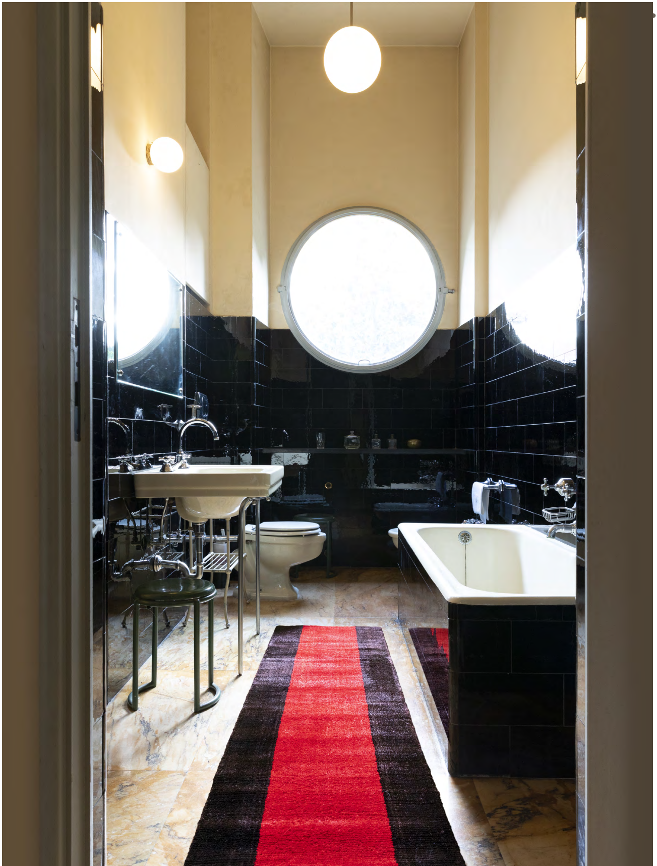
Rosso Vivo 2 limited edition 70 x 240 cm | 2'3" x 8' ft