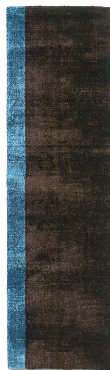
Turchese 2 limited edition 70 x 240 cm | 2'3" x 8' ft