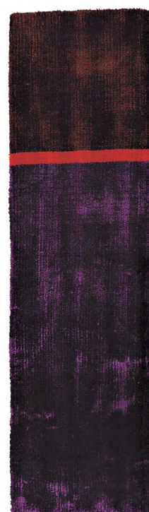
Viola Astratto 2 limited edition 60 x 200 cm | 2' x 6'6" ft