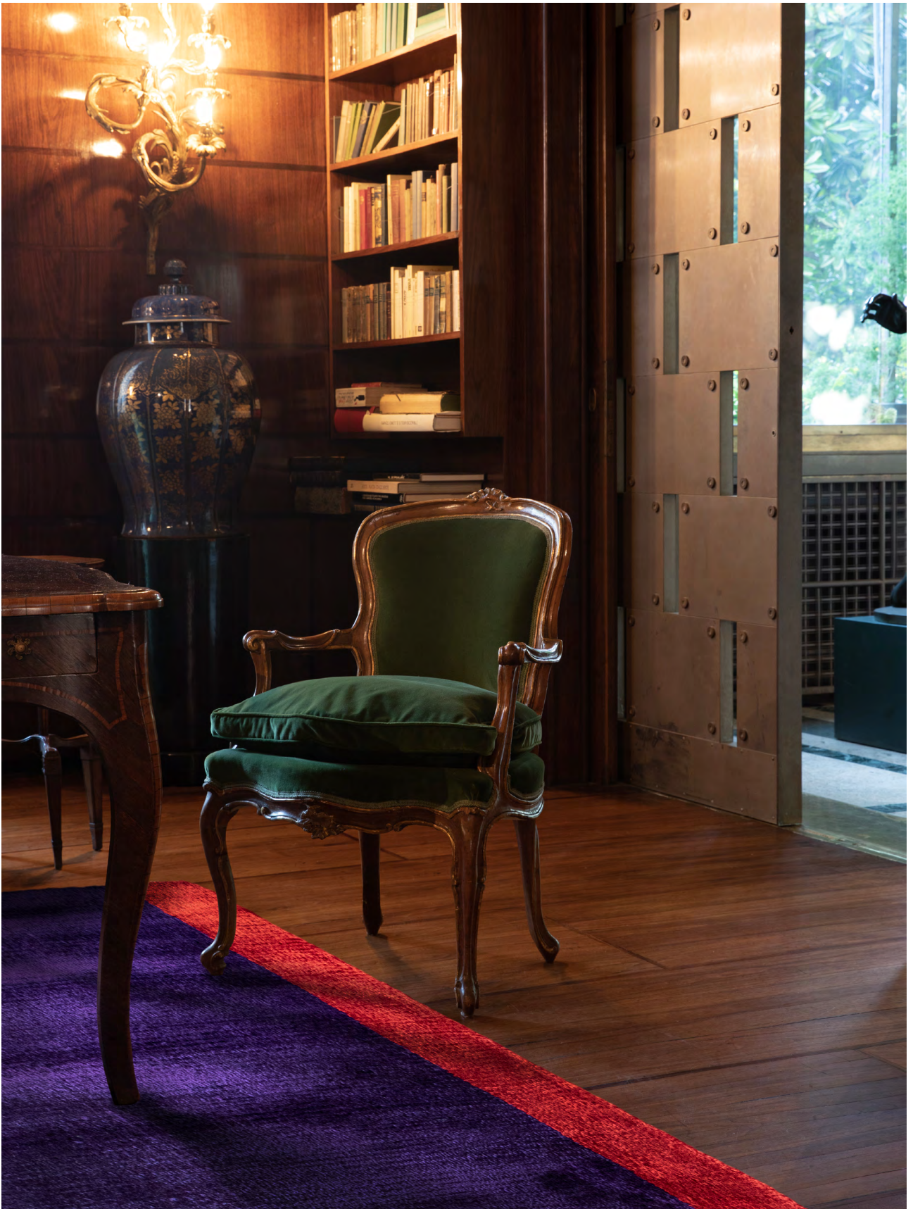
Viola Astratto 1 limited edition 200 x 240 cm | 6'6" x 8' ft