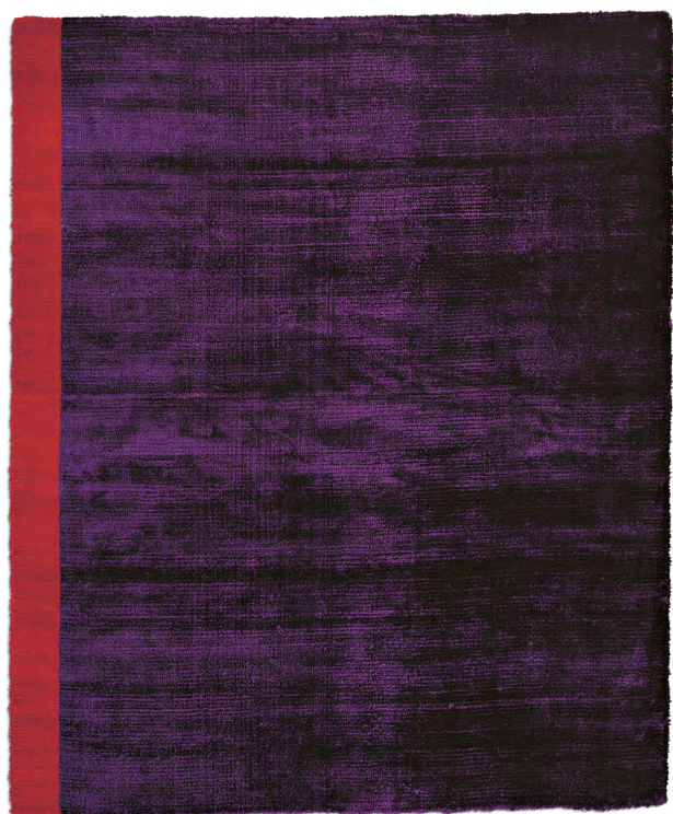
Viola Astratto 1 limited edition 200 x 240 cm | 6'6" x 8' ft