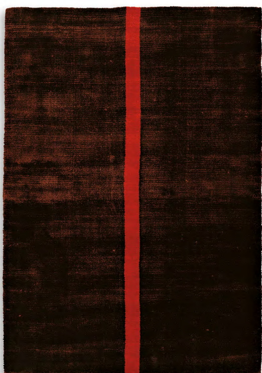
Rosso Vivo 1 limited edition 170 x 240 cm | 5'7" x 7' 10" ft