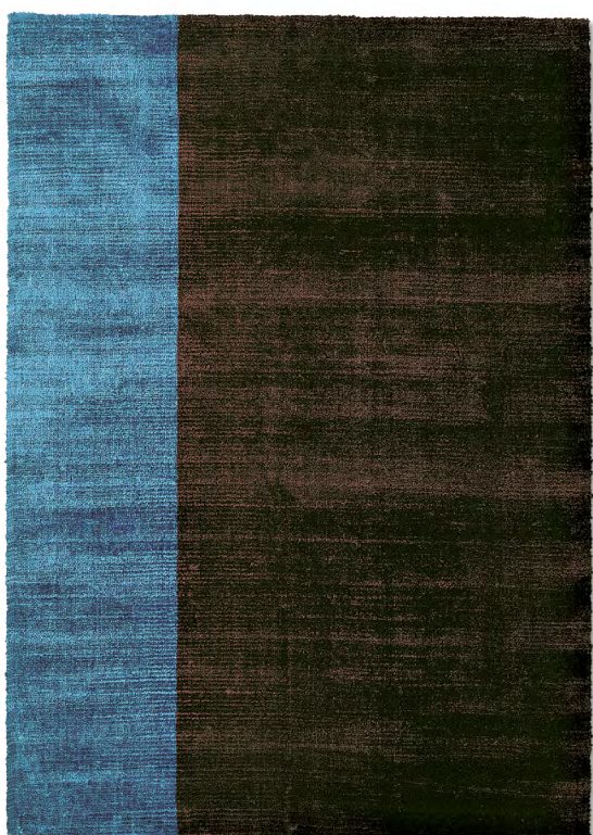
Turchese 1 limited edition 170 x 240 cm | 5'7" x 7' 10" ft