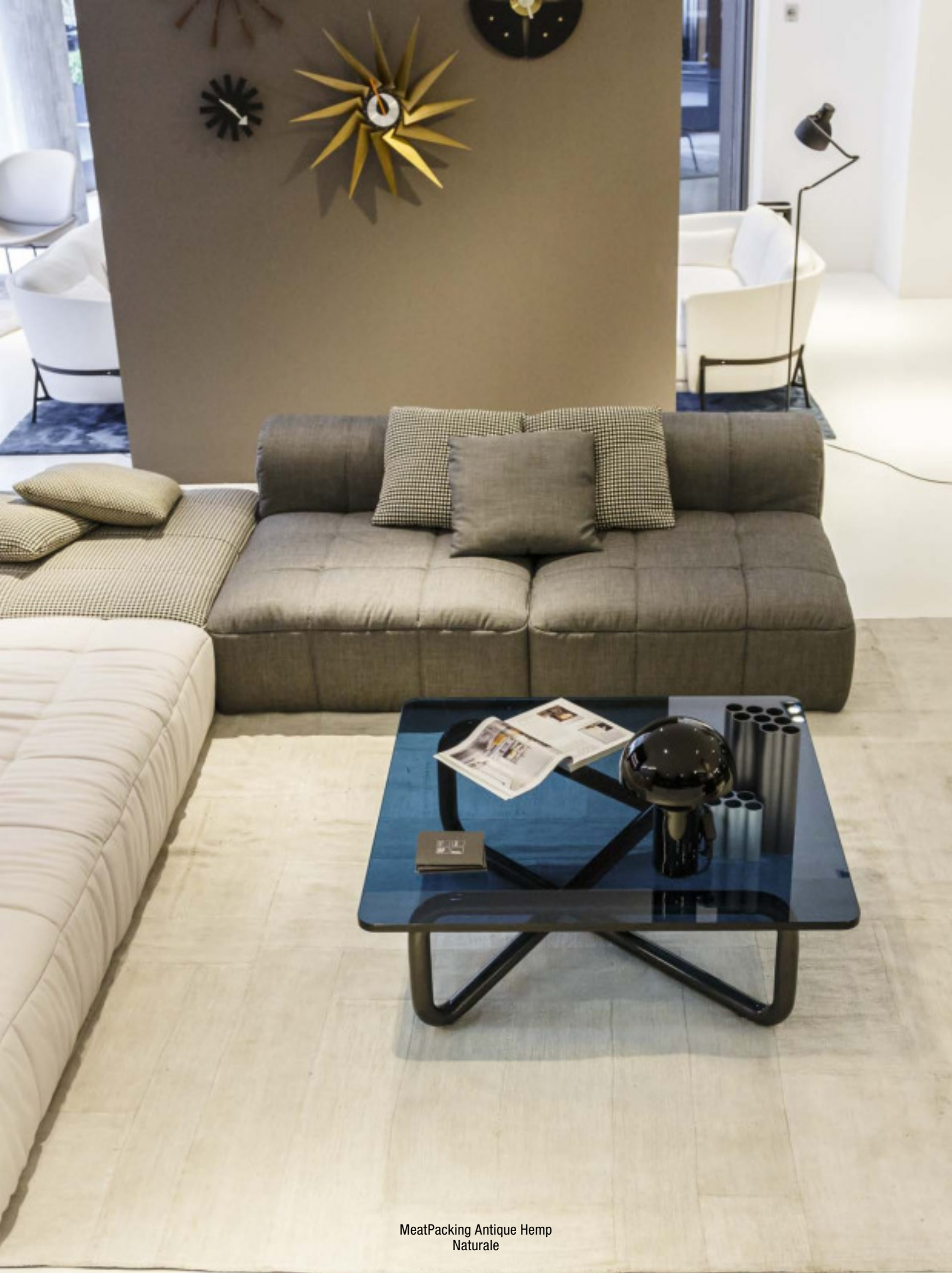
MeatPacking Antique Hemp Naturale