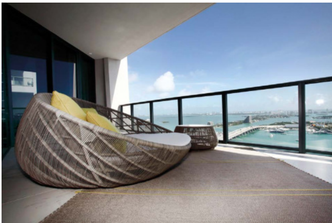
Passo Doppio Argento Felt 05