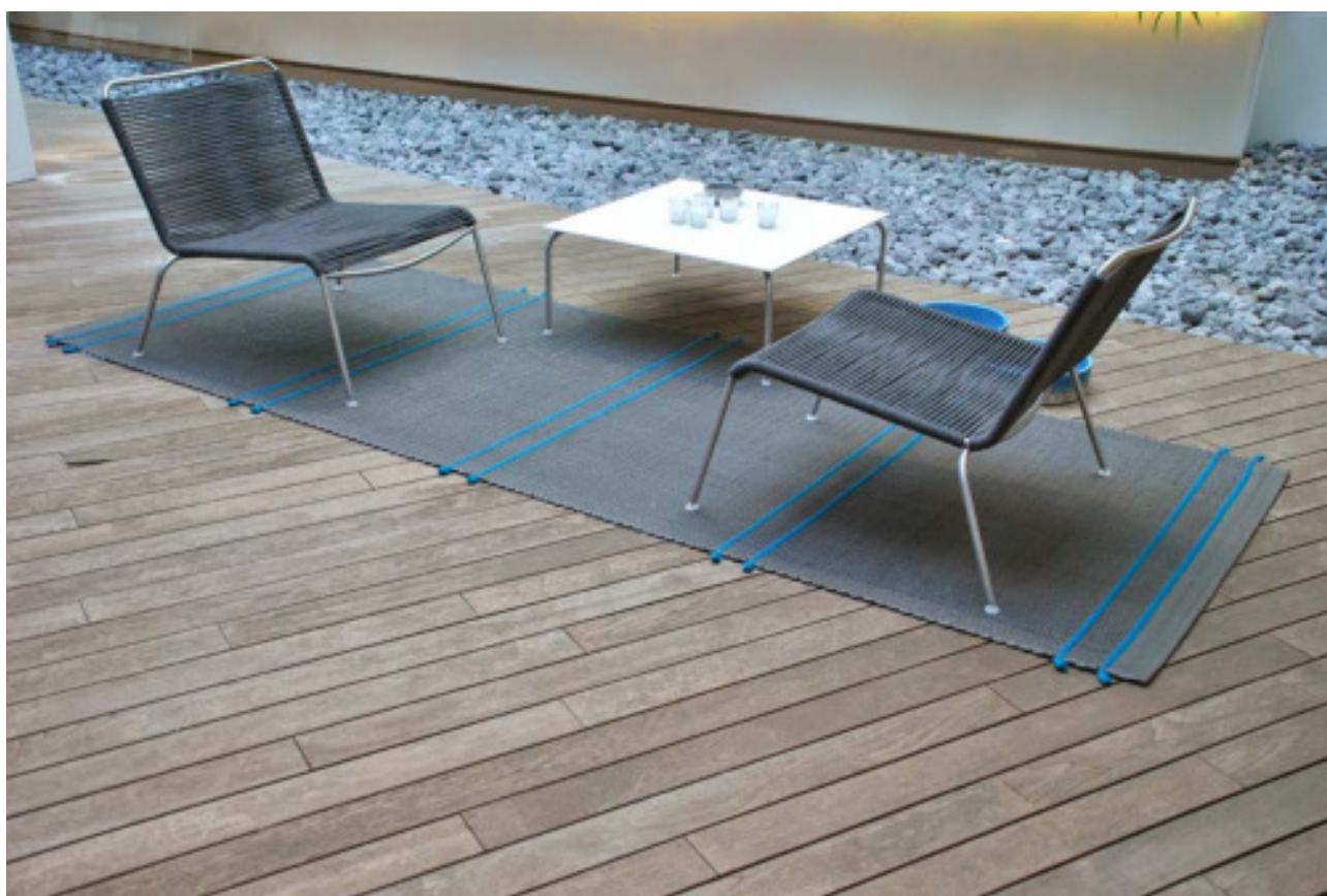
Passo Doppio Grafite Felt 07