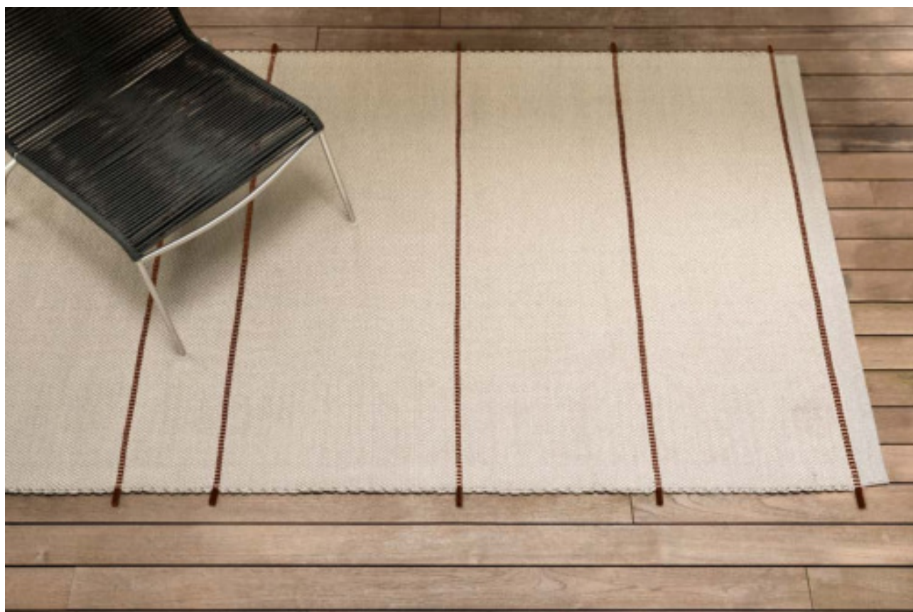
Passo Doppio Argento Felt 44